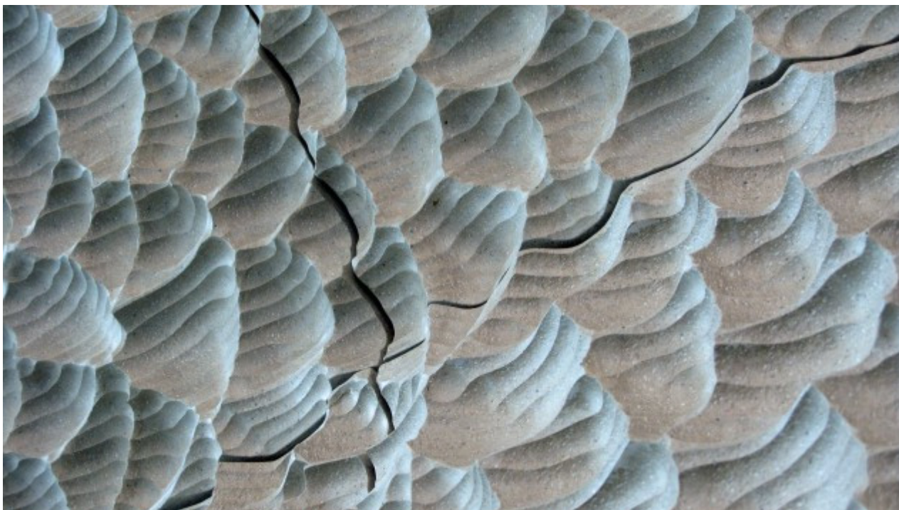
Elbphilharmonie: Die so genannte "Weiße Innenhaut" des Konzertsaals besteht aus zehntausend Paneelen, deren unterschiedliche Formen vom Computer berechnet wurden.